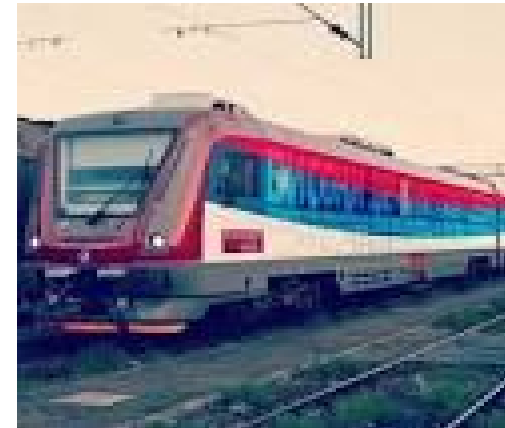
ТЕХНИЧАР ЖЕЉЕЗНИЧКОГ САОБРАЋАЈА